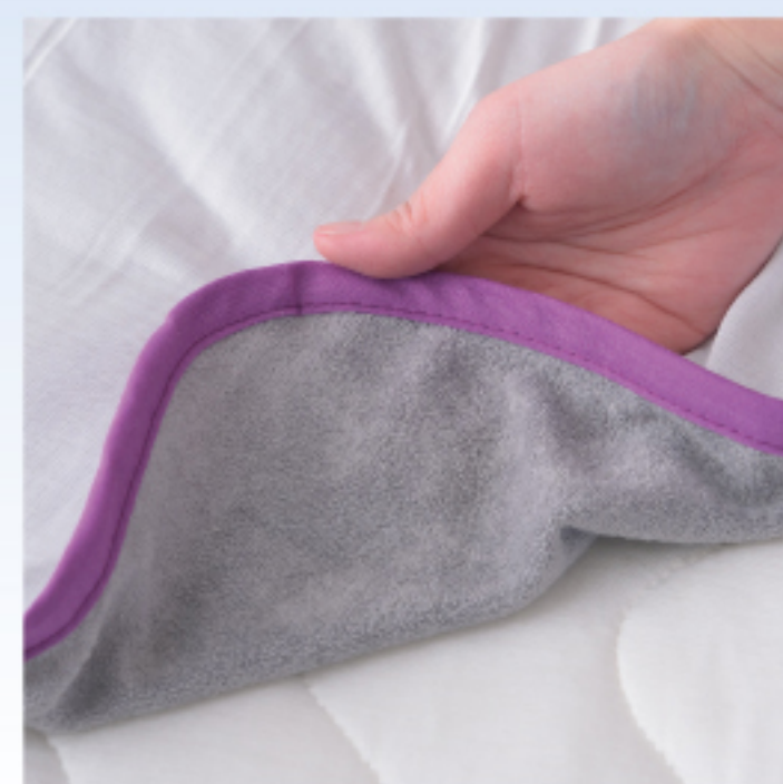
ブランケットの裏地は パイル地を使用