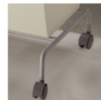
キャスター付きで移動も 可能です。

RSD-107MIX ¥12,600 [本体価格 ¥12,000] W59×D40.2×H55.3cm 3分類連結キッチンペール60JF ロット2 本体・フタ・袋止め・キャスターキャップ/PP フタパッキン/発砲EPDM フレーム/スチール (粉体塗装仕上げ) 容量: 21L x 3