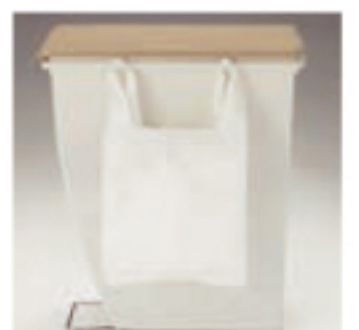
フックにポリ袋がかけ られます