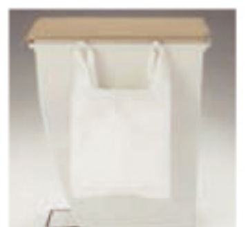
フックにポリ袋がかけ られます

ナショナルコード メーカーコード アイテムコード C/D POS-No./49-71881-□□□□□□□□