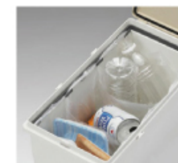
レジ袋で3分類に仕分け することができます