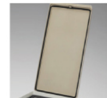
ゴミの臭いが漏れにくい パッキン付き (20JF)