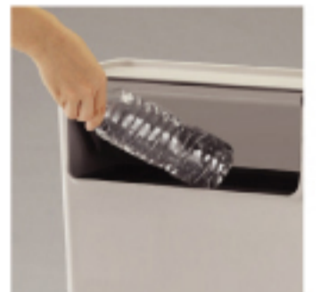
押して捨てられる薄型 設計