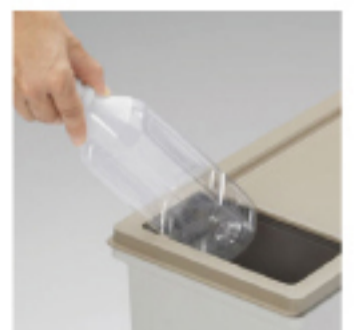
プッシュフタ付き (20JP)