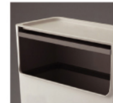
大口径のフラップと開閉 ホールド機能