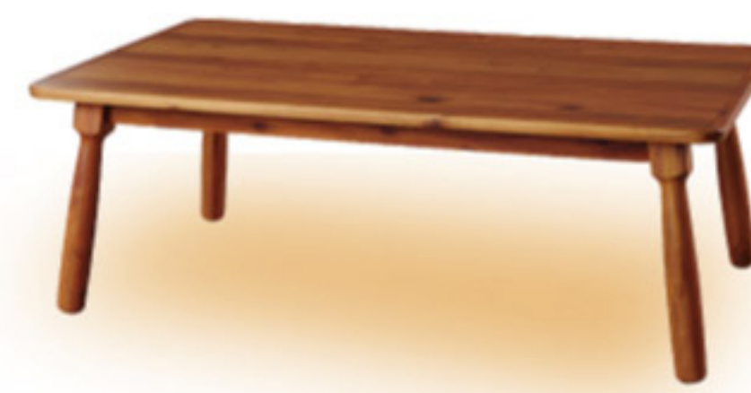
TABLE & FUTON

ボリュームをもったシーブポアのフチ取りはあたたかみを表現。素朴な印象を持ちながらチェックのかわいらしさも引き立ててくれます