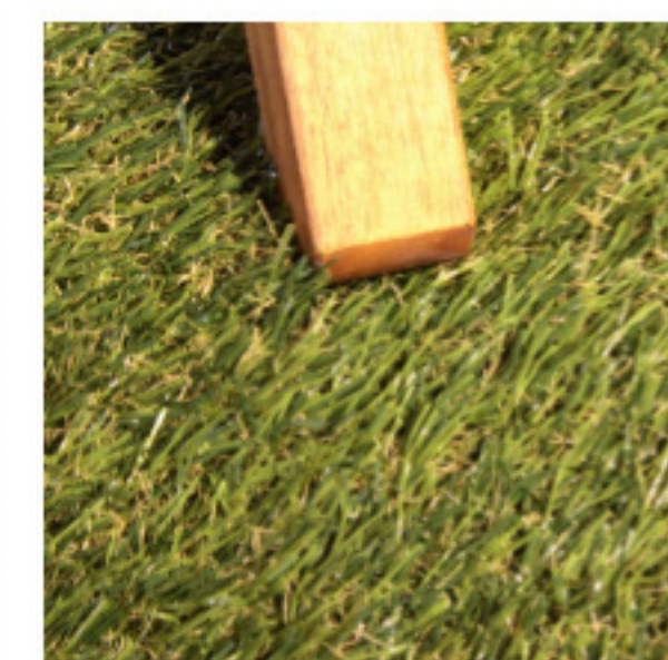
様々なスポーツの公式グラウンドに使用されています。

DIS-199 171330 ¥8,000〔税別〕 W200cm 人工芝生 ロット m単位 ※販売はm単位となります。