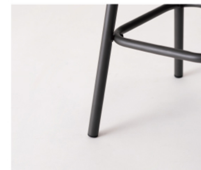
美しいスチール脚