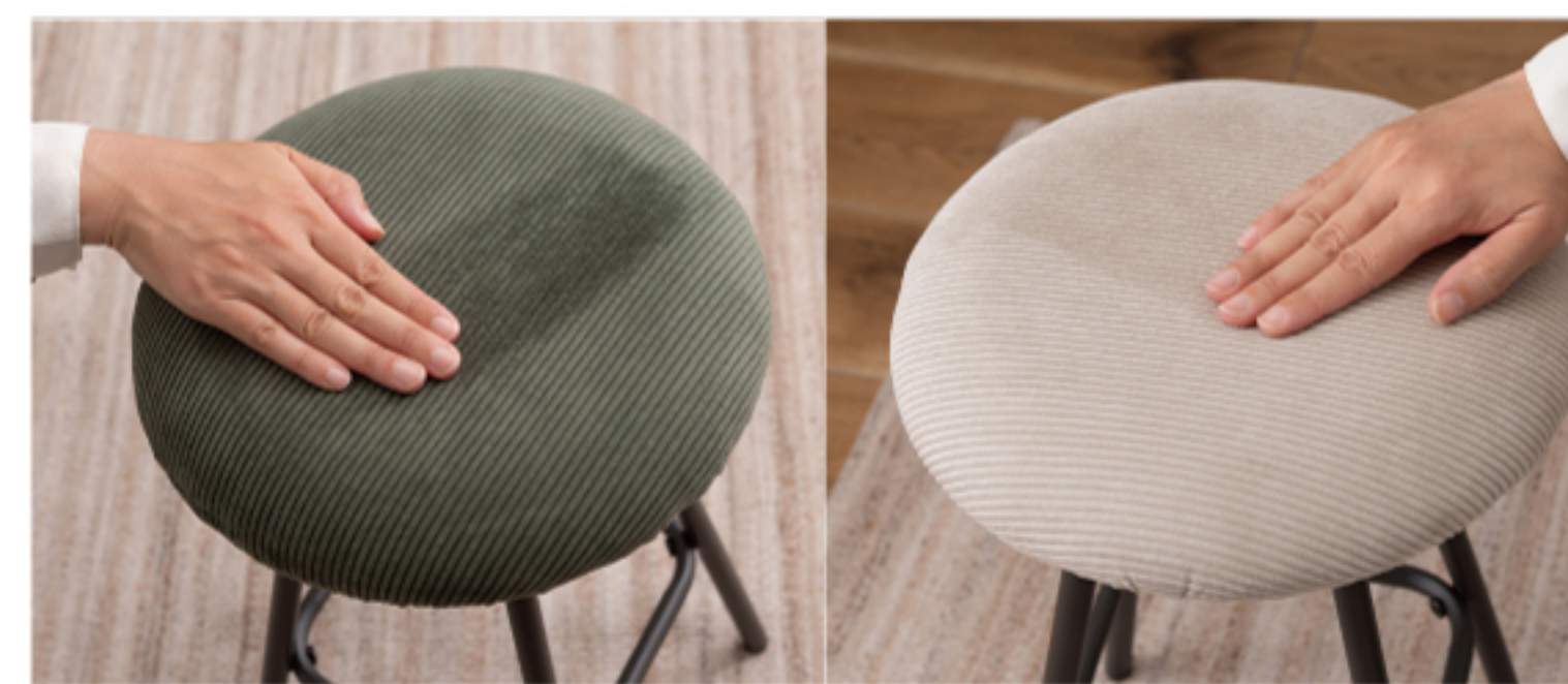
手触りの良いコーデュロイ生地 (PC-15GR/LGY)