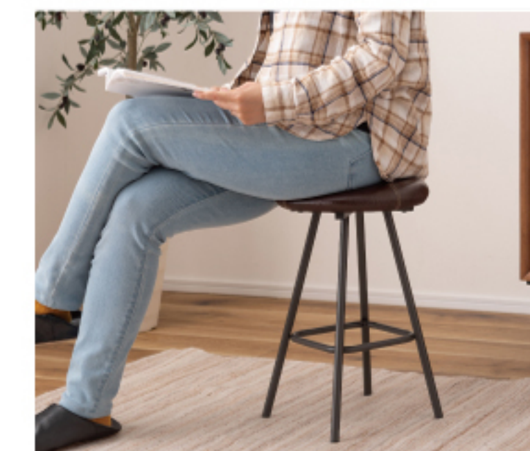
安定感のある座り心地