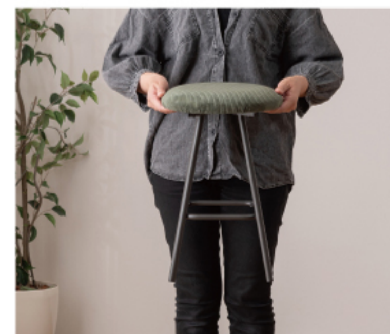
軽量で持ち運びやすい