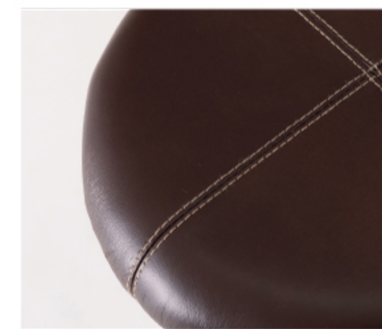
風合いのあるボンデッドレザー (PC-16BR)