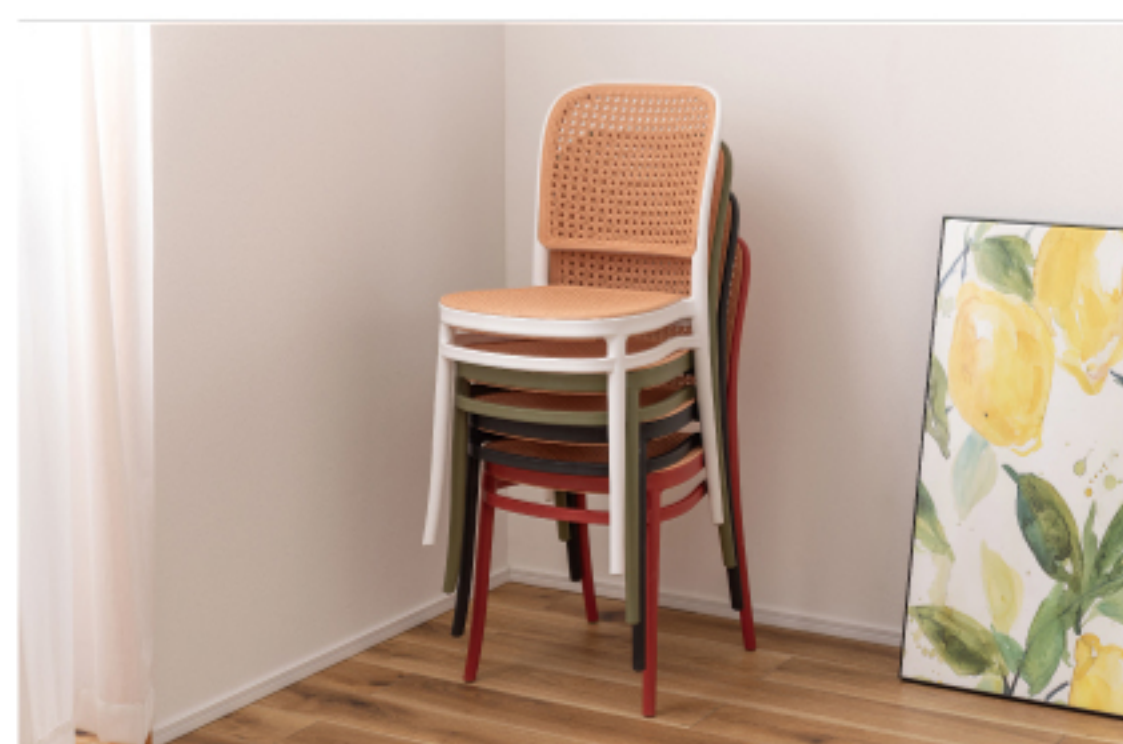
スタッキングができるため場所を取りません

背面と座面にラタン調のデザインを施した、トレンド感溢れるグレイスチェア。ポリプロピレン製なので軽量で耐久性があり、傷や汚れに強いのも嬉しいポイント。どのカラーも落ち着いた合わせやすい色味をチョイスしており、お部屋ではもちろん、ガーデンシーンにもよく馴染むデザインです。スタッキング可能なので場所を取らずに収納する事が出来ます。