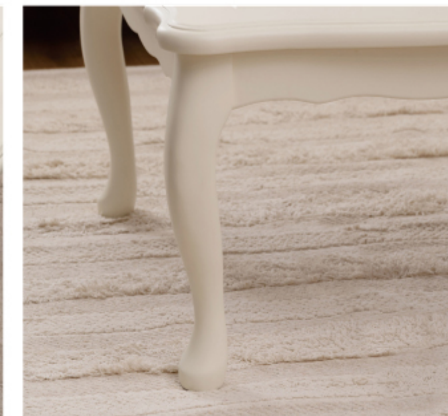
曲線が美しい猫脚