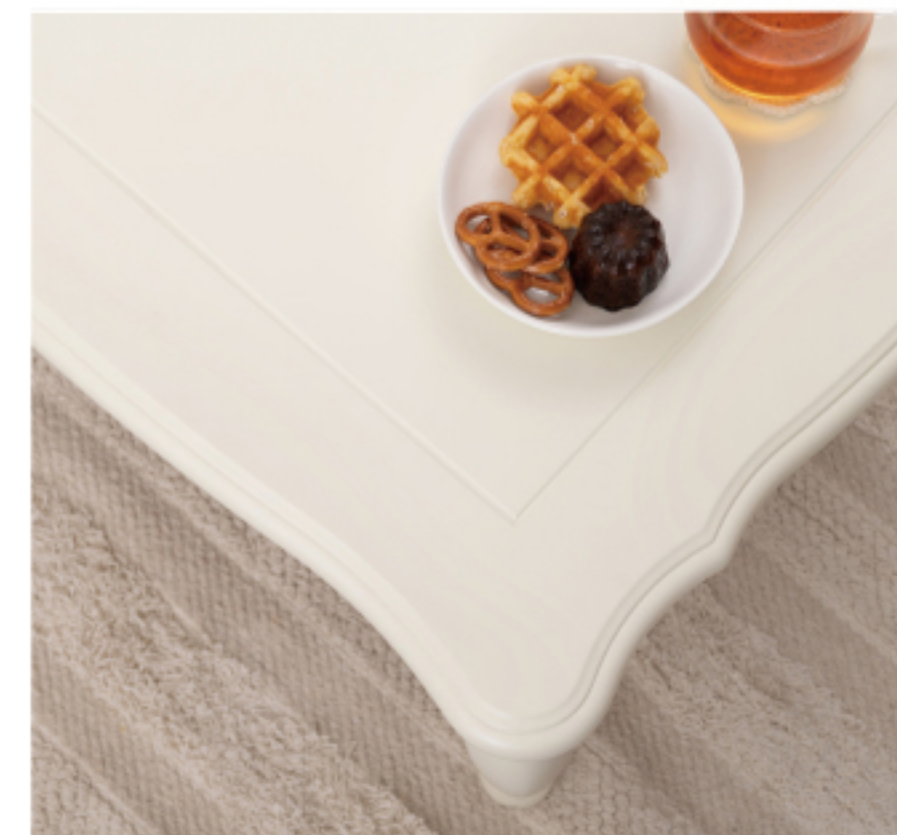
デザインにこだわった天板の装飾

広いスペースが必要なこたつも小さめに作られているので、 こたつとしての使用時や、TVボードをおいた空間でも圧迫感がなく 使用できます。