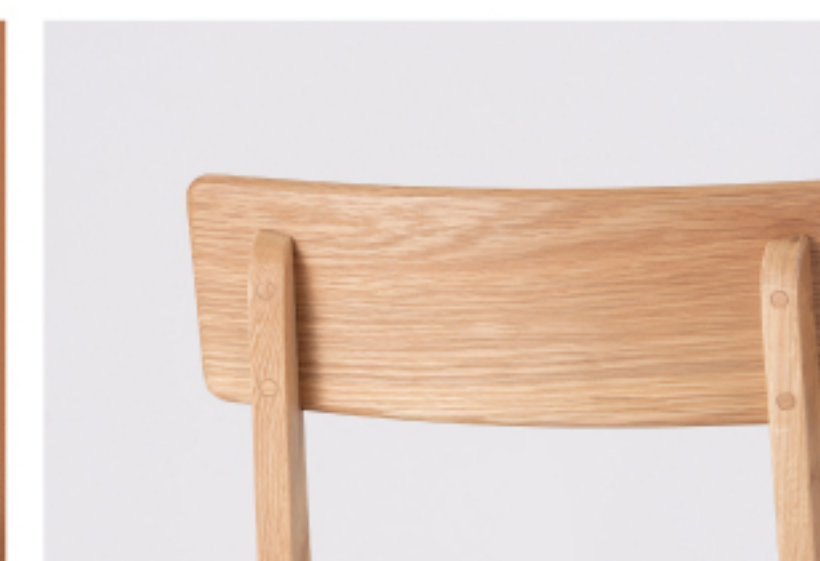
天然木を感じるデザイン