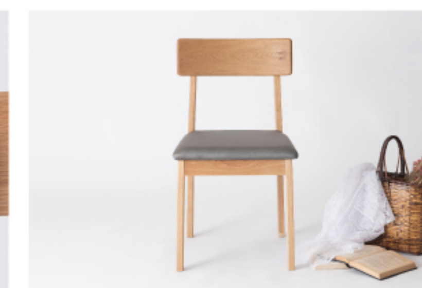
飽きの来ないシンプル設計

※この商品は通常掛け率と異なります。卸価格については営業担当までお問合せください。