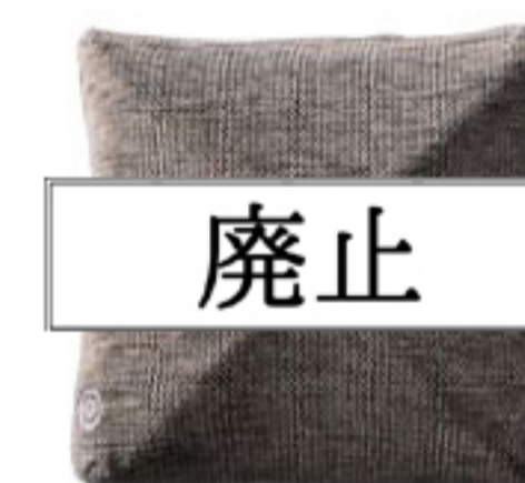
アッシュベージュ