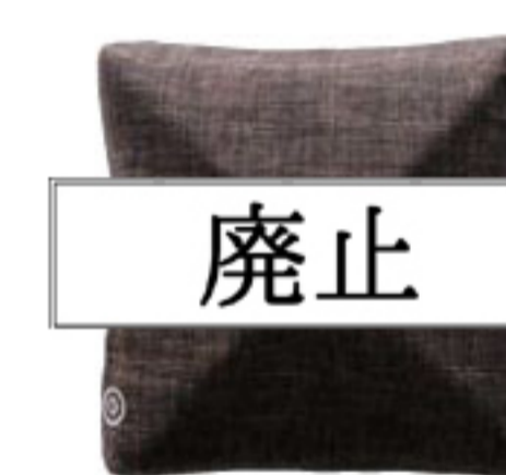
シャイニーブラウン